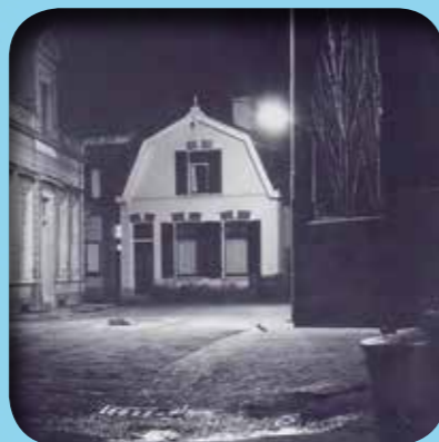
Het huis aan de Torenstraat in Ede waar generaal Hackett zat ondergedoken.

Zo hebben ze heel veel mensen gered. Wie werd betrapt door de Duitse soldaten kreeg vaak de doodstraf. Het Mausoleum bevat alle namen en – heel bijzonder – een aantal graven van verzetsstrijders uit Ede. Om even bij stil te staan... We hebben ook straten en plantsoenen in Ede vernoemd naar een aantal dappere verzetsstrijders.