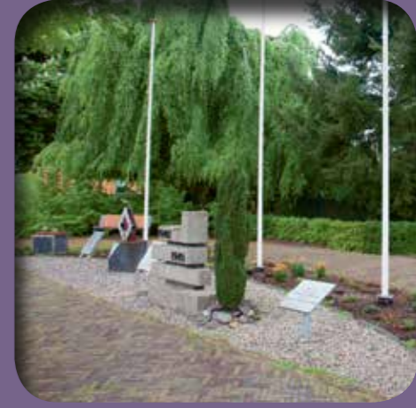
Memorial Park, Ede